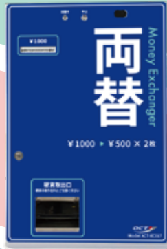
カウンタータイプ (ACT-EC017-S-05)